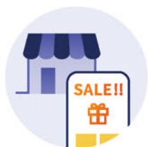
スーパーマーケット